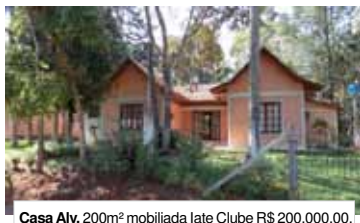
Casa Alv. 200m² mobiliada late Clube R$ 200.000,00.

Chácara com aprox. 3,5 alq. Vileiros R$ 180.000,00.