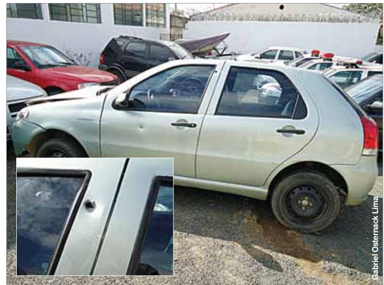
Detalhe de tiro disparado contra o veículo durante perseguição.

No cruzamento da rua Gaspar Bertoni com a BR 277, sentido Rocio 2, a PM montou um bloqueio com o objetivo de interceptar o veículo, o qual novamente desobedeceu a ordem de parada, desviando da viatura e arremessando o veículo em direção a um policial, o qual se jogou no chão, evitando ser atropelado. Ao cruzar a BR 277 em alta velocidade, o condutor do Palio perdeu o controle do veículo, indo em direção a um barranco, passando ao lado de um poste de iluminação pública, descendo novo barranco já na