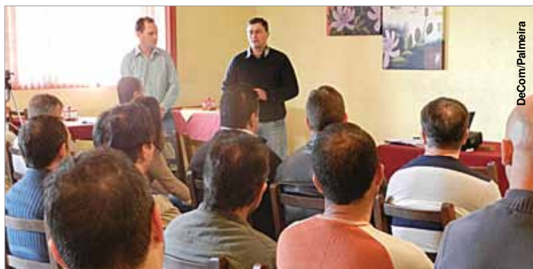
Prefeito e vice esclarecem sobre reestruturação durante a reunião.

“A atual Secretaria sofre com o acúmulo de funções e se torna inviável a gestão e captação de recursos de tantos segmentos dife-