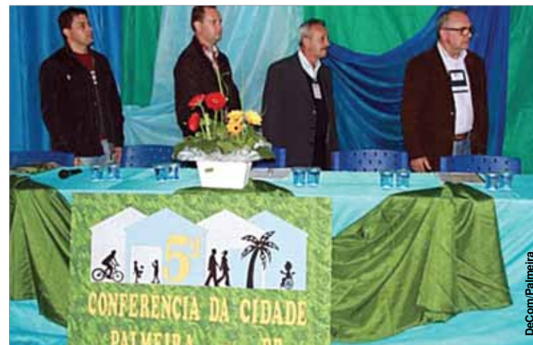
Mesa de honra na abertura da Conferência Municipal.

Na etapa municipal da Conferência das Cidades, agentes públicos e comunidade organizada reunidos fizeram uma avaliação e definiram prioridades à política de desenvolvimento urbano do município