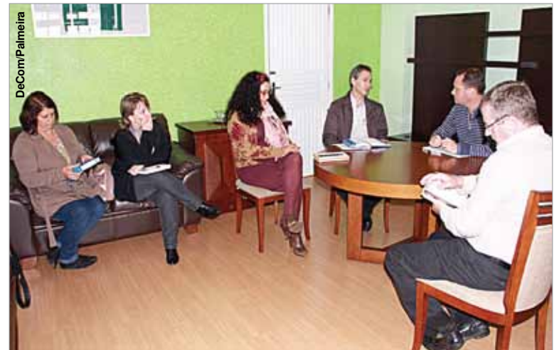
Representantes do Conseg apresentaram assuntos ao prefeito.

Também teve destaque na reunião o monitoramento por câmeras de vigilância, além do pedido para que a Prefeitura interceda junto a Secretaria de Segurança, apoio