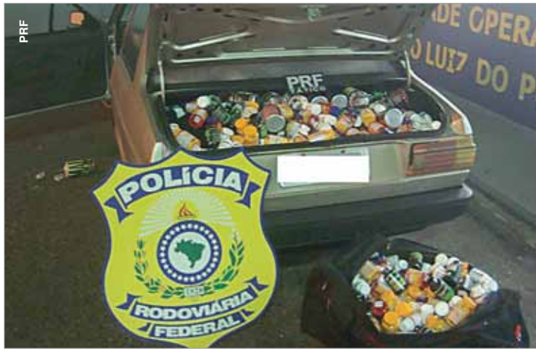
Veículo transportava mais de 24 mil cápsulas de suplementos.

O Grupo Tático da PRF realizava uma fiscalização em conjunto com outros policiais, quando abordou um Voyage na praça de pedágio. Ao verificar o portamalas do veículo, foi descoberta uma grande quantidade de suplementos sem os devidos registros aduaneiros. Após ter sido flagrado cometendo o ato, o condutor fez uma proposta de dividir a carga para que ele fosse liberado, o que configurou o crime