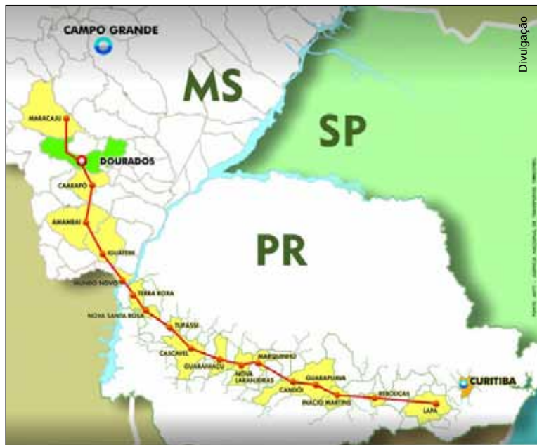
Traçado definido do novo ramal ferroviário.

A expectativa dos especialistas é de que o ramal atraia mais investimentos para a região, que poderão beneficiar Palmeira diretamente. Estima-se que os principais setores a serem beneficiados são