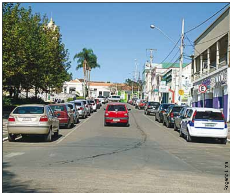
Frota do município de Palmeira já soma 15.747 veículos.

Somente no mês de maio, a frota de veículos emplacados em Palmeira aumentou em 137 unidades. De dezembro de 2012 para maio deste ano, o número de veículos com placas de Palmeira passou de 15.324 para 15.747, o que representa 423 veículos a mais circulando no município.