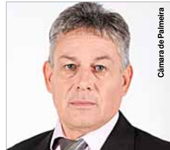
Câmara de Palmeira