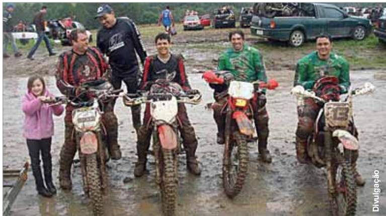
Trilheiros palmeirenses que participaram do encontro.