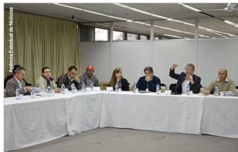
Trabalho também deve melhorar a qualidade do leite paranaense.

"Vamos trabalhar em conjunto com a Ocepar, Faep, Fetaep, Fiep, Emater, sindicatos rurais, da indústria do leite entre outras entidades ligadas ao setor pecuário, esclarecendo sobre a importân-