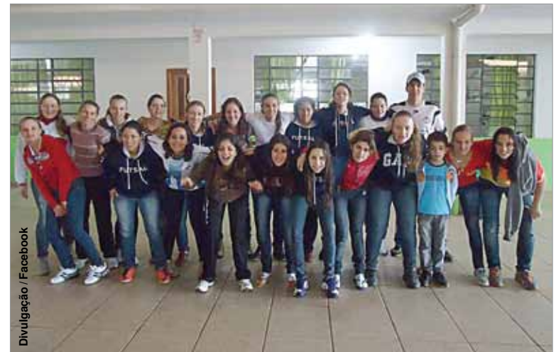
Equipe de futsal obteve um empate e duas vitórias na primeira parte da fase.

O voleibol masculino não encontrou dificuldades e venceu to-