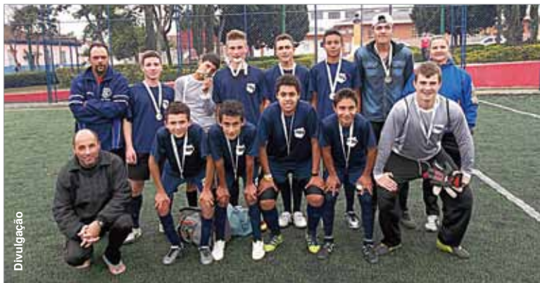
Time do Real Bagi, campeão do Torneio de Futebol Suíço Juvenil.

No último sábado (15) foi realizado o Torneio de Futebol Suíço Juvenil Masculino, promovido pelo Departamento de Esportes de Palmeira. Atletas nascidos em 1997 e anos posteriores puderam partici-