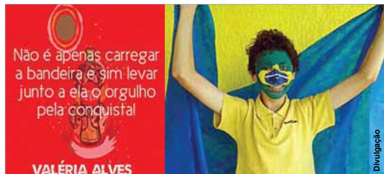
Frase e fotografia foram escolhidas por votação popular.

50 adolescentes foram escolhidos pela Coca-Cola, patrocinadora do evento, e ganharam passagens viagens até a cidade de destino que sediará o jogo, hospedagem de duas noites em hotel, alimentação, transporte na cidade de destino, seguro viagem