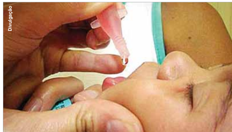
1.958 crianças com idade de seis meses a quatro anos foram vacinadas.

O grupo com melhor cobertura em Porto Amazonas foi com crianças de três anos de idade, onde 68, das 54 que deveriam ser vacinas, foram imunizadas, resultando em 125,93%. O grupo formado por crianças entre seis meses e um ano incompleto teve o menor desempenho, com 85,29% de cobertura, com 29 crianças imunizadas das 34 que formavam a meta.