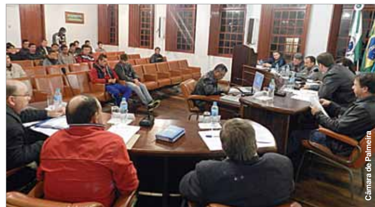
Sessão da Câmara contou com a presença de cerca de 30 manifestantes.