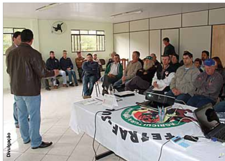
Reunião definiu representantes e suplentes das regiões.