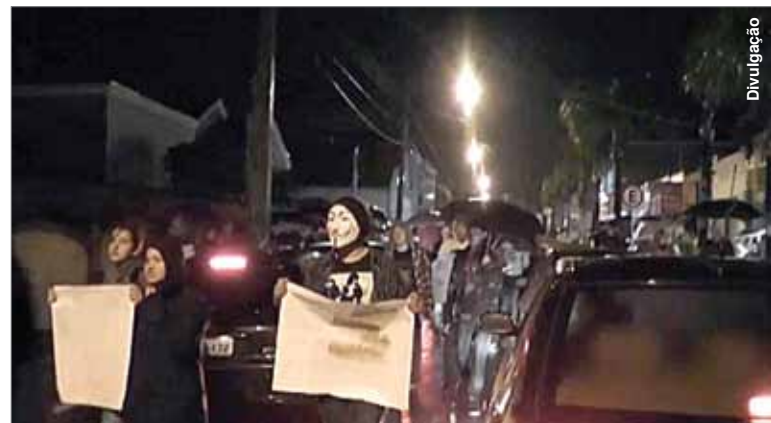
Manifestação percorreu trecho da rua Conceição, até a frente da Prefeitura.

Apesar da forte chuva e da temperatura baixa, cerca de 200 pessoas foram pra rua na quinta-feira (20), em Palmeira, no início da noite, para uma manifestação que já vinha sendo programada há alguns dias. Os manifestantes iniciaram a concentração na praça Domingos Theodorico de Freitas, em frente ao Cemitério Municipal, de onde partiram em passeata pela rua Conceição até a praça Marechal Floriano Peixoto, e na rua 15 de Novembro houve concentração e alguns pronunciamentos.