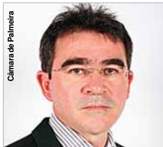
Câmara de Palmeira