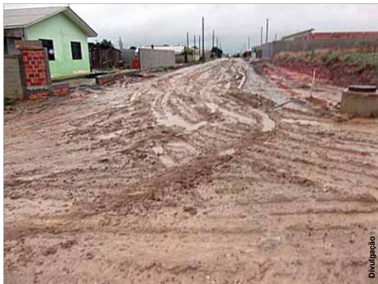
Ruas do Bela Vista estão intransitáveis e pioraram após a chuva.

Nos dois casos, a Prefeitura de Palmeira tem recursos do governo federal, através do Programa de Aceleração do Crescimento, no valor de mais de R$ 7,6 milhões, para drenagem, pavimentação e urbanismo. Pelo cronograma, as obras que foram inicia-