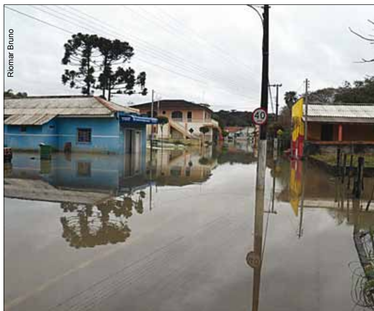
Trecho da rua João Pessoa foi totalmente encoberto pela água.

As partes mais baixas da cidade, nas proximidades do rio Iguçu, como nas ruas Jesuíno Marcondes, Barão do Rio Branco,