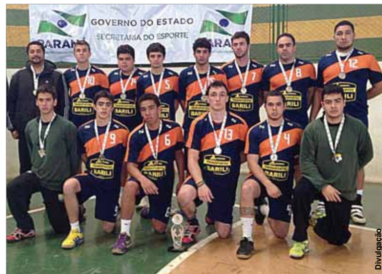
Handebol masculino obteve a segunda colocação na fase regional.

Já o futsal feminino terminou a fase com a quarta colocação, fruto de duas derrotas. No sábado