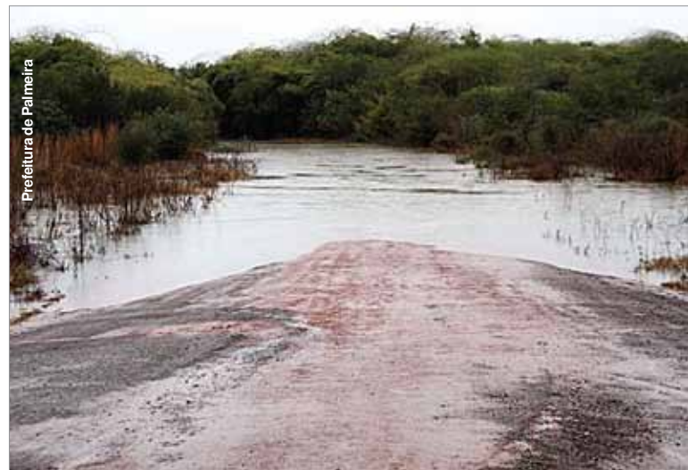
Ônibus dos roteiros escolares não conseguem trafegar em alguns trechos.

“Nossa decisão partiu do senso comum de proteger a vida e colocá-la em primeiro lugar. Para garantir a total segurança dos alunos, optamos por suspender as