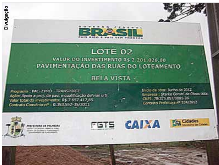
Placa indica que obra teve início há um ano e ainda não foi entregue.

das em junho do ano passado deveriam estar concluídas neste mês, mas não foi o que aconteceu devido aos problemas com a