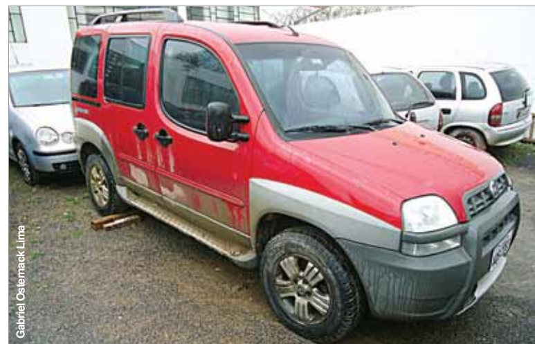
Veículo foi abandonado na estrada vicinal de Correias.

Explosões e trocas de tiros A agência do Banco do Brasil