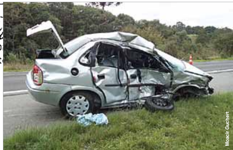
Passageira do Corsa Classic foi a vítima fatal do acidente.

O Classic trafegava sentido Curitiba a Palmeira e seu motorista teria perdido o controle do veículo e rodado na pista, vindo a colidir lateralmente com a frente