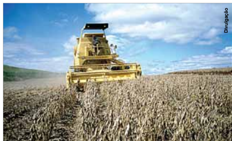
Aumento foi de 11,4% em relação ao mesmo período do ano passado.

A área plantada total chegou a 53,22 milhões de hectares. A cultura da soja continua ocupando o maior espaço, com 27,72 mi-