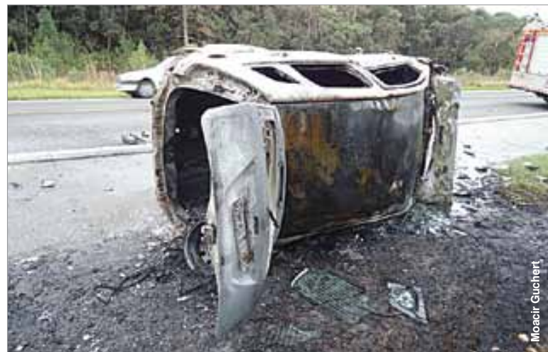
Os dois ocupantes do Fiesta sofreram ferimentos graves.

do Fiesta, que trafegava sentido oposto, segundo informou à Polícia Rodoviária Federal o motorista do Fiesta. O acidente aconteceu em um trecho de reta e as causas deverão ser investigadas.