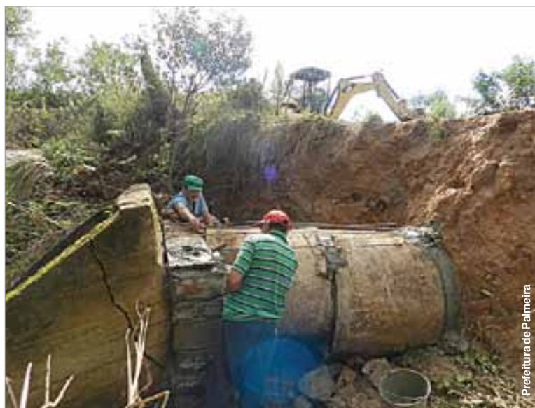
Equipes estão trabalhando para recuperar as estradas danificadas.

Em Sessão Ordinária, os vereadores do interior já pediam a paciência da população pela gra-