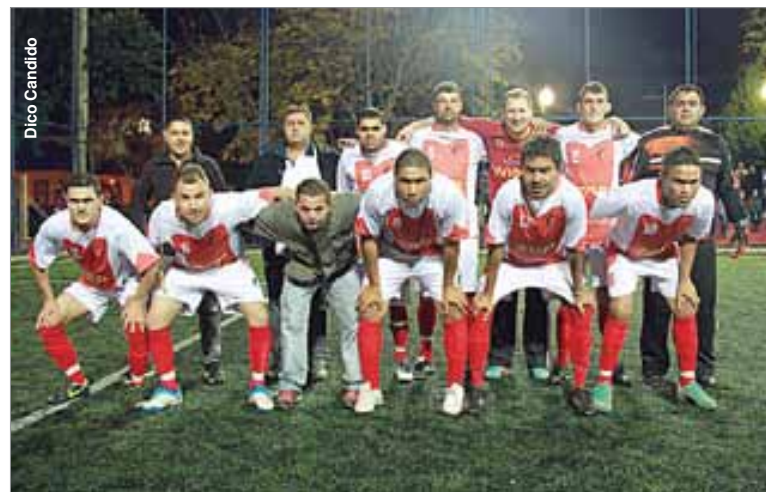
Poliart: campeão da 1ª Copa de Futebol Suíço de Palmeira.