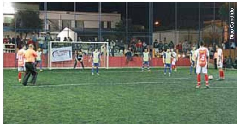
Mesmo abrindo dois gols de vantagem no placar, Mega Net recebeu virada.