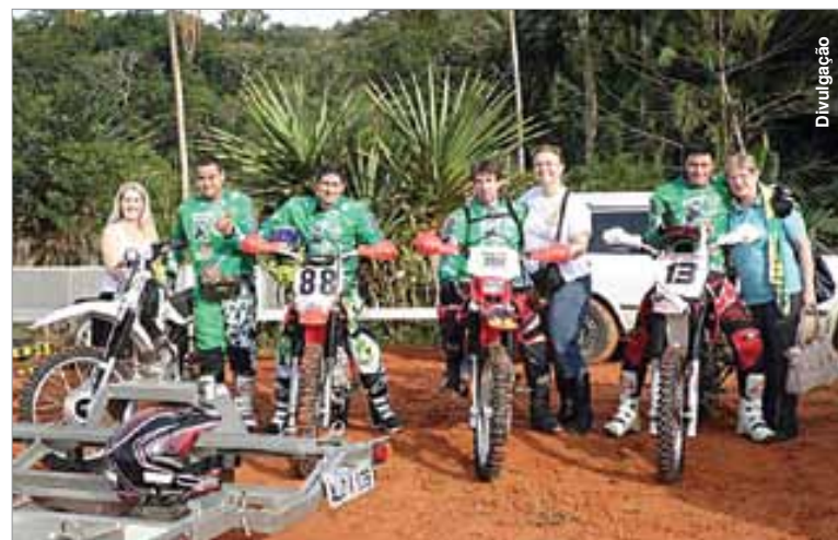
Palmeirenses estiveram entre os 3.312 trilheiros que participaram do evento.

O percurso percorrido pelos trilheiros foi de 60 quilômetros,