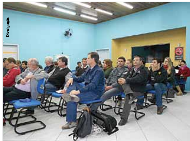
Comitiva de Palmeira entregou solicitação de adesão durante reunião.

Para fazer parte de um território, o município deve ter espaço físico geograficamente definido e não necessariamente contínuo, caracterizado por critérios multidimensionais tais como ambien-