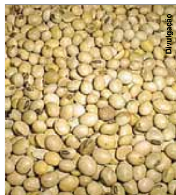
Grãos foram afetados pelas chuvas.