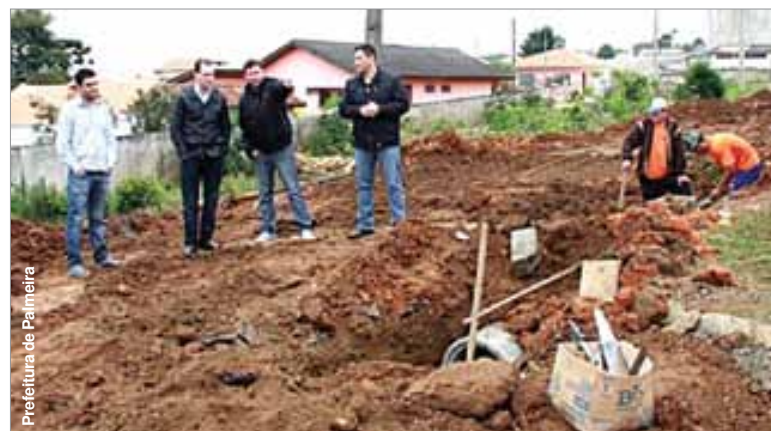
Obra foi retomada com trabalhos no sistema de captação de água pluvial.

A empreiteira responsável por realizar as obras de pavimentação, drenagem e paisagismo da avenida Daniel Mansani retomou as obras no início da semana. Segundo a própria empreiteira, o excesso de chuva no último mês impossibilitou que a empresa continuasse realizando os trabalhos no local.