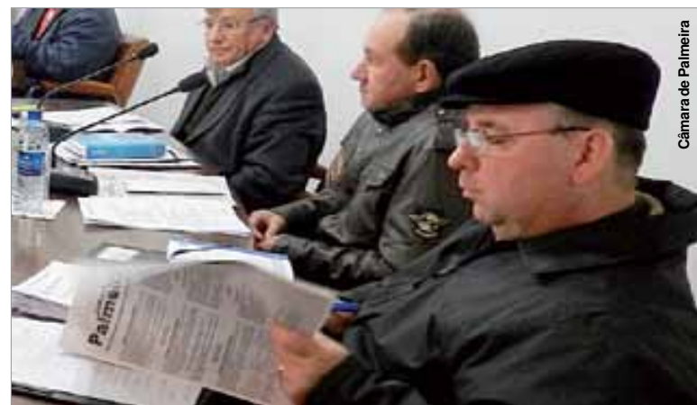
Câmara de Palmeira

O projeto de lei que estabelecia a prorrogação dos mandatos dos atuais conselheiros do RPPS foi mais um que, este ano, causou polêmica no âmbito da Câ-