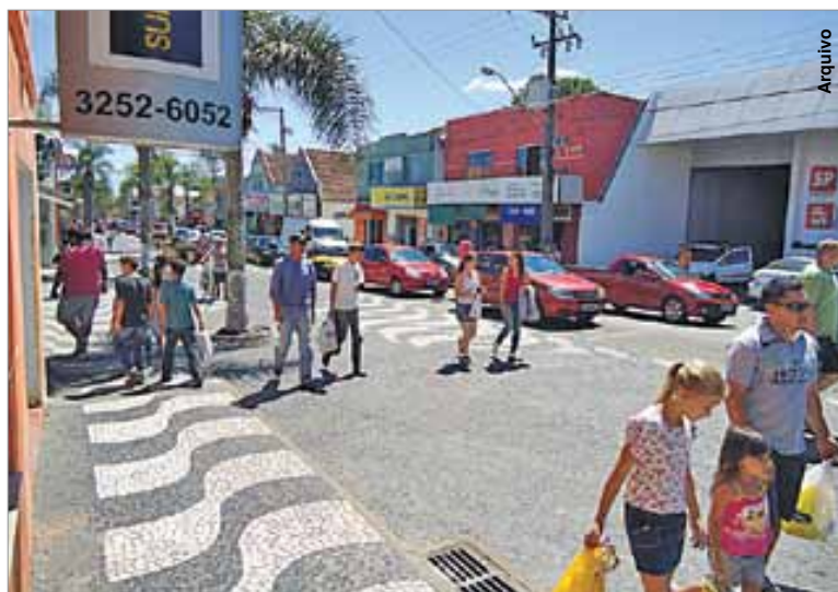
Esperança de vida passou de 65,27 para 74,56 anos.

Um dos fatores que explica o aumento da esperança de vida em