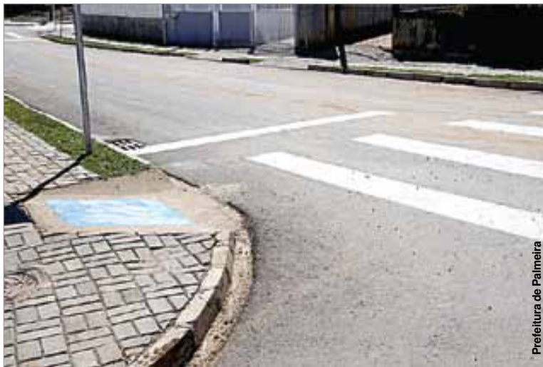
Além da sinalização horizontal, adaptações de acessibilidade foram feitas.

A exemplo das adaptações realizadas no centro da cidade e nos principais bairros, as calçadas do núcleo Parque dos Papiros possuem rampas de acesso para cadeirantes. As obras de sinaliza-