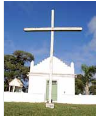
Capela de Nossa Senhora das Pedras.

além da exuberante paisagem natural, é a capela construída em 1880 e inscrita como bem tombado pelo Patrimônio Histórico do Estado do Paraná. Desde 1895 são realizadas festas religiosas naquele local, atraindo moradores de toda a região.