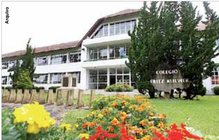
Sessão itinerante será realizada no Colégio Fritz Kliewer.