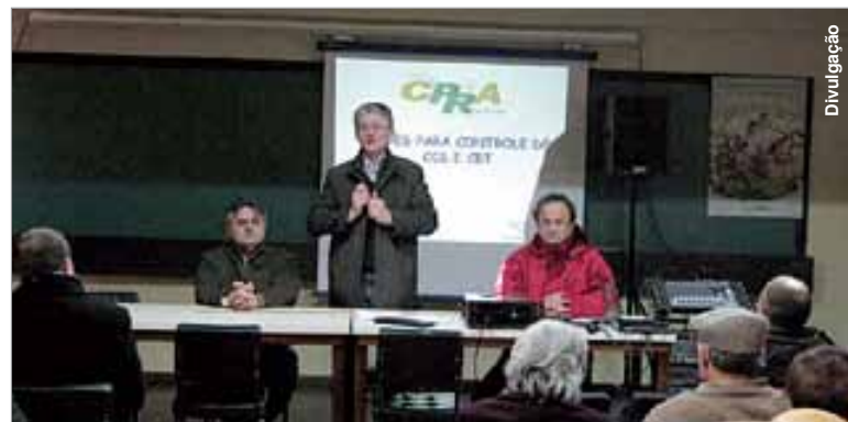
Secretário participou da abertura do evento em Pinhais.

O secretário de Estado da Agricultura, Norberto Ortigara, destacou na abertura do evento a intensificação de ações para aumentar a produtividade, a qualidade e a sanidade do leite no Paraná. "A nossa meta é proporcionar que o nosso produtor leiteiro seja muito melhor do que ele já é hoje. Para isso, buscamos consolidar o estado como primeiro e segundo no cenário nacional de produção de leite, disse. O importante é aprender, trocar experiências e capacitar ainda mais a área técnica", explicou o