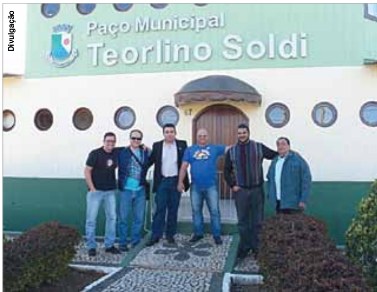
Ato de fundação reuniu pessoas ligadas ao levantamento de peso.

No último sábado (27), um grupo de pessoas composto por admiradores, atletas, ex-atletas, treinadores de levantamento de peso e educadores físicos, convocados pela comissão de organização, através de circular de convocação e convites, estiveram em Porto Amazonas com a finalidade de fundar a Federação Esportiva de Levantamento de Peso do Estado do Paraná (FELP-PR).