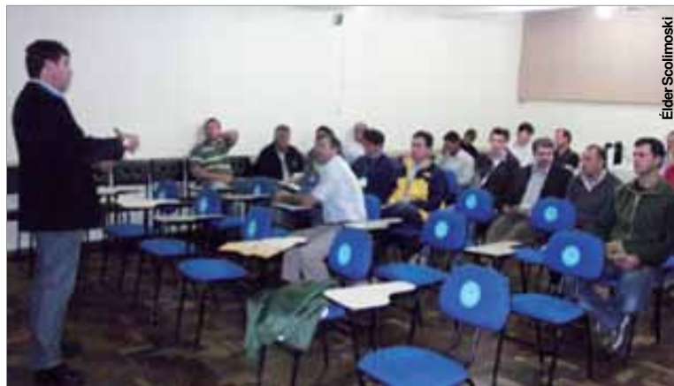
Evento de lançamento da feira que acontece em janeiro de 2014.

A Montebello Eventos será a realizadora da feira, juntamente com a Associação dos Engenheiros Agrônomos do Paraná. O evento deve reunir empresas locais e de outros municípios. Além da Prefeitura Municipal, a feira terá apoio também do Sindicato Rural.