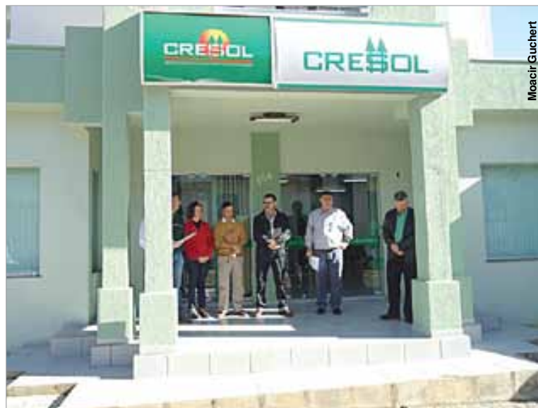
Autoridades estiveram presentes na inauguração da Cresol de Palmeira.

A Cresol conta com cerca de 120 mil associados e é um Sistema de Cooperativas de Crédito