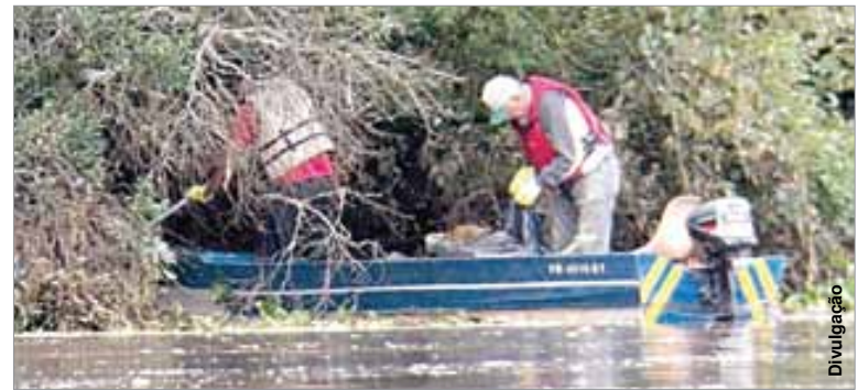
Cerca de 300 kg de lixo são retirados do rio Iguazu em cada ação de limpeza.

Está programada para o dia 14 de setembro a limpeza do Rio Iguazu, em Porto Amazonas. Regularmente a ação é feita em um trecho que varia de 11 a 22 km, e normalmente são retirados cerca de 300 quilos de material inorgânico das margens e do leito do rio.