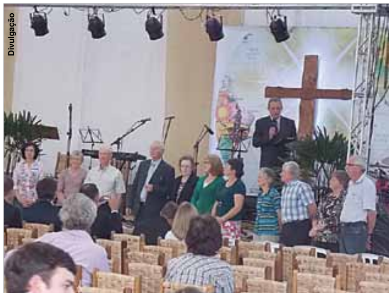
Centenas de pessoas acompanharam a comemoração em Witmarsum.