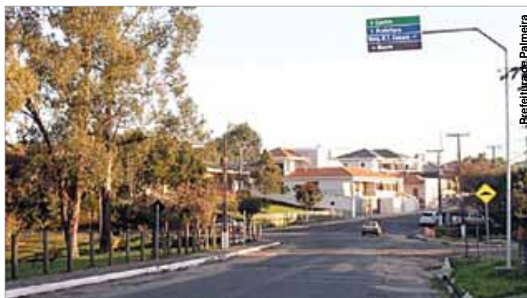
Placa instalada na rua Santos Dumont, próximo ao encontro com a PR-151.

A primeira placa instalada fica localizada no início da rua 15 de Novembro, no trevo com a PR-151, enquanto a segunda está na rua Santos Dumont, próxima ao encontro com a PR 151. As outras três placas serão colocadas na rua Padre Camargo, próximo à rodoviária, outra na rua Dom Alberto Gonçalves, próximo ao cruzamento com a PR 151 e, por fim, uma no alto da rua Conceição.