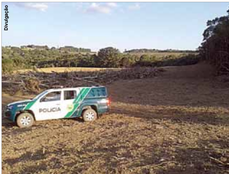
Polícia Ambiental atendeu ocorrências em Porto Amazonas e Teixeira Soares.

Por volta de 11h30, na localidade de Ribeirão de Cima, também em Teixeira Soares, a equipe policial avistou uma motocicleta Biz 125, placa AAG-7220, em atitude suspeita. Ao realizar a abordagem foi verificado que a mesma estava com a numeração do chassi raspada e inelegrável, e a placa com lacre rompido. Em consulta no sistema policial foi verificado que a placa seria de uma motocicleta roubada em março de 2012, na localidade de Turvo, em Palmeira. O condutor da moto também não possuía habilitação.