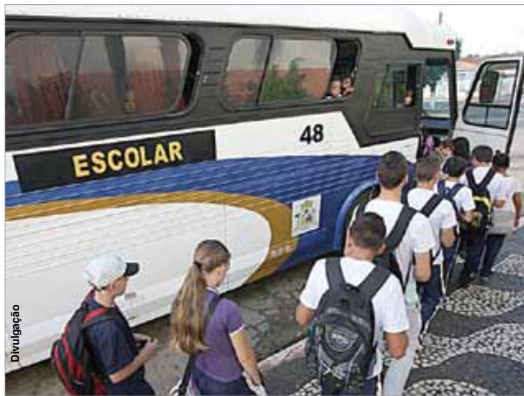
Valor compensa pelo transporte de estudantes da rede estadual.

Na quarta-feira (31), o Estado divulgou uma tabela contendo os valores a serem complementados no Paraná, expondo as cifras que chegam a R$ 10,8 milhões. Hoje, o Governo Estadual repassa R$ 80 milhões às Prefeituras, mas estudo técnico da Associação dos Municípios do Paraná (AMP) aponta que ainda faltam mais R$ 80 milhões. No encontro, Arnês destacou o compromisso assumido pelo governo Beto Richa (PSDB) de, até