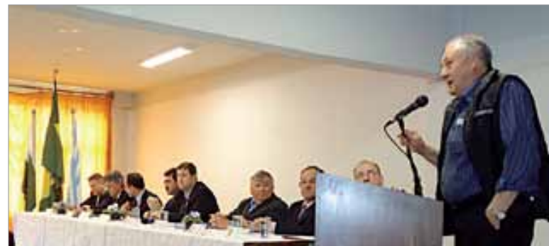
Representante da comunidade fala durante a sessão em Witmarsum.