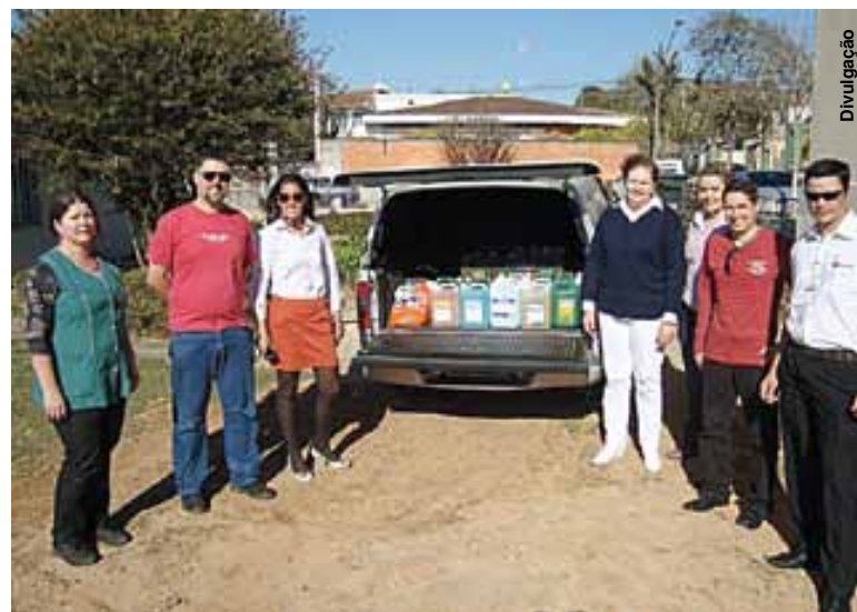
Hospitais foram beneficiados com a entrega de materiais de limpeza.

O evento sem fins lucrativos foi realizado por um grupo de amigos, apaixonados pelo es-