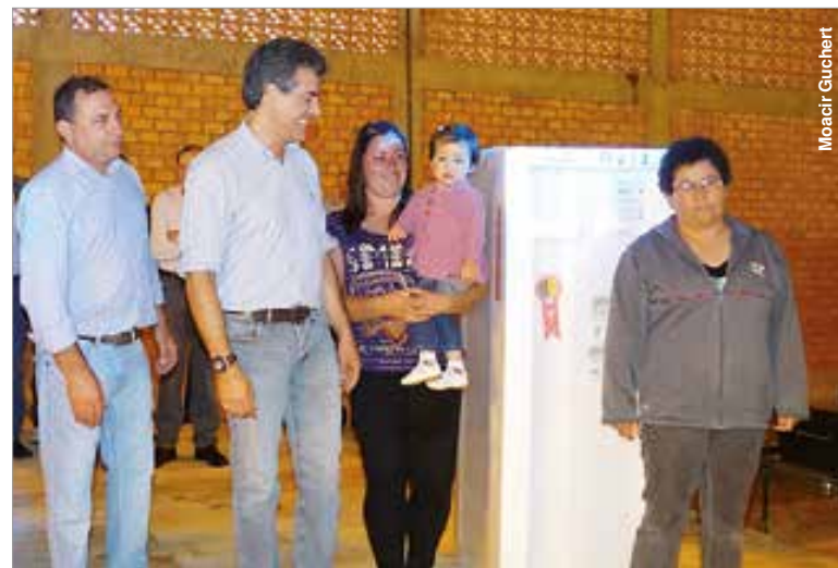
Governador entrega geladeira de programa da Copel para família.

São João do Triunfo recebe recurso a fundo perdido do Plano