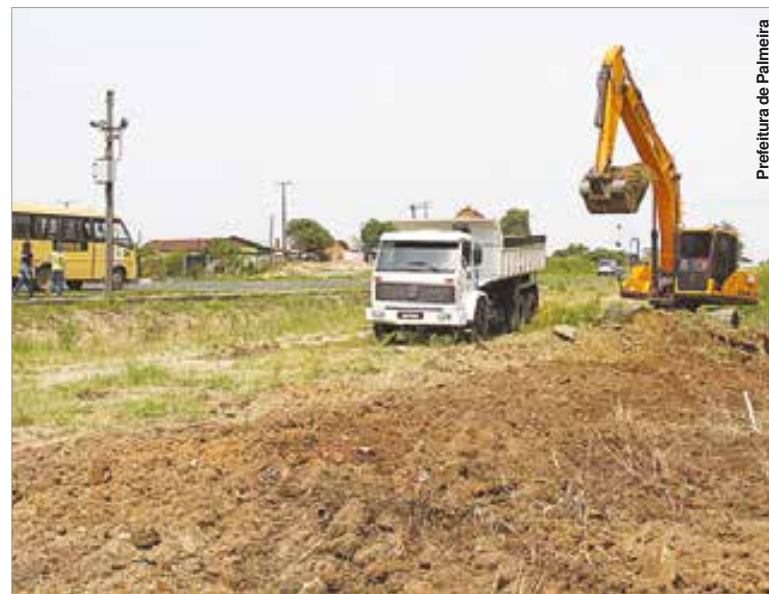
Prefeitura de Palmeira

A construção da trincheira ligando os dois bairros deve oferecer mais segurança para pedestres e veículos que fazem a travessia da BR 277. O movimento no local é intenso devido ao grande número de morado-