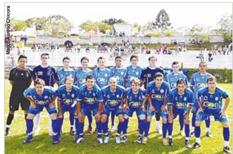
Após estar perdendo por 2 a 0, Baixada conseguiu virar a partida.

Na categoria juvenil a equipe triunfante foi derrotado por 1 a 0. No domingo (26) a Baixada vai até Balsa Nova, onde enfrenta o Corcovado.