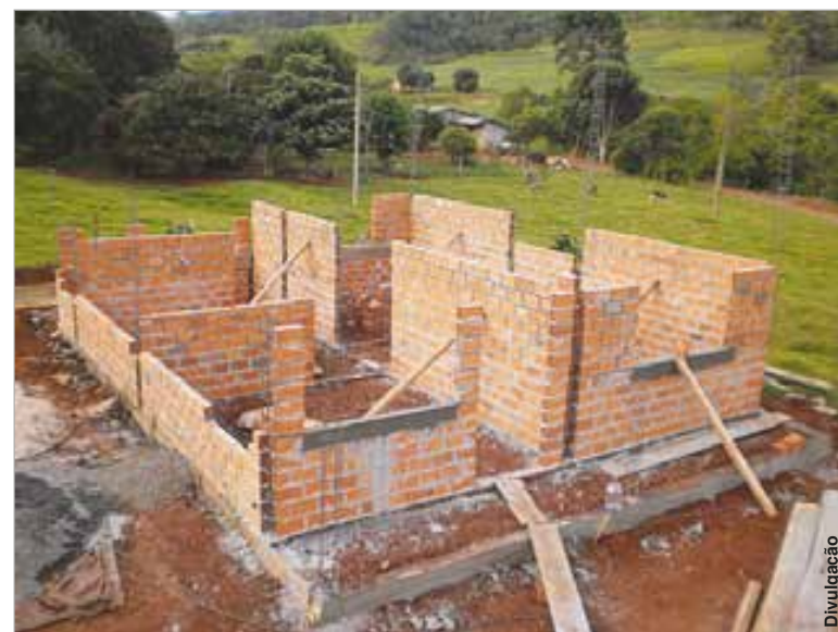
Agricultores familiares poderão aderir ao programa de habitação rural.

A inclusão dos agricultores familiares da região no programa se deu através do Projeto Caprichando na Morada, da Federação dos Trabalhadores na Agricultura Familiar da Região