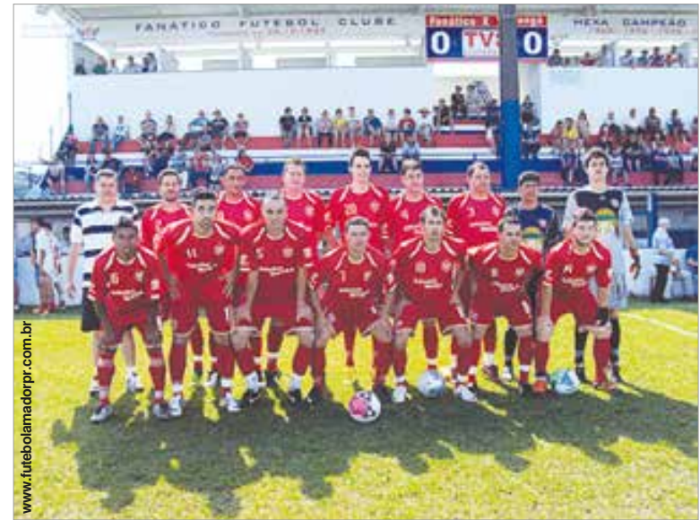
Ypiranga estreou fora de casa e conquistou seus três primeiros pontos.

palmeirenses foram derrotados por 1 a 0. Neste domingo (26) o Ypiranga joga em casa, no Estádio João Chede, onde enfrenta o Renascença de Porto Amazonas, às 16 horas.