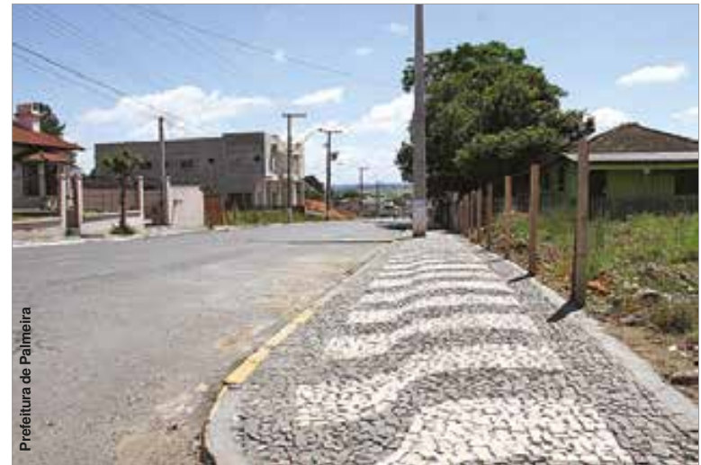
Prefeitura de Palmeira

As ruas do núcleo Parque dos Papiros ganharam placas de preferencial e indicação de peso