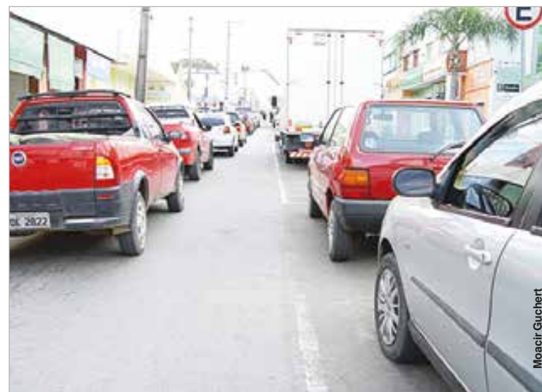
Nos últimos seis anos, frota palmeirense recebeu acréscimo de 6 mil veículos.

Todos os proprietários de veículos são obrigados a pagar anualmente o Imposto sobre a