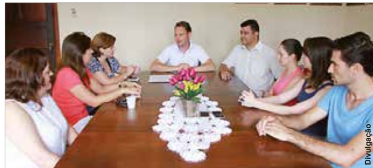
Reunião na qual aconteceu a entrega do projeto do PMAT à Caixa.

madamente dois meses seja finalizada a avaliação do projeto entregue à Caixa.