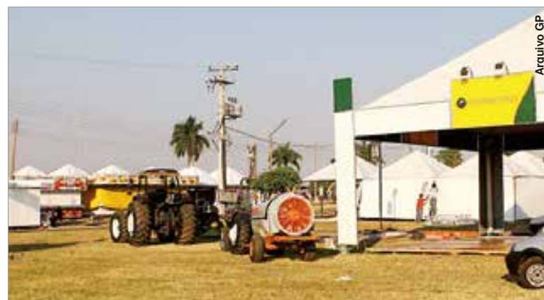
Feira deve ter presença de empresas fornecedoras do agronegócio.

A Secretaria de Agricultura de Palmeira, juntamente com o Sindicato Rural de Palmeira e a Federação dos Engenheiros Agrônomos do Paraná são os promotores do evento, que conta com o