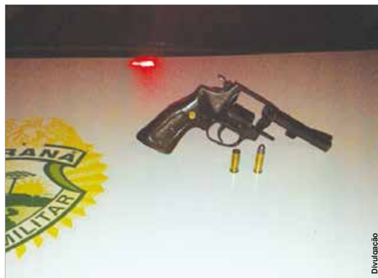
Calibre .38 estava com uma munição deflagrada e numeração raspada.

Refazendo o trajeto da fuga, policiais encontraram um revólver calibre .38 com uma munição intacta e uma deflagrada, além de numeração raspada. Os policiais