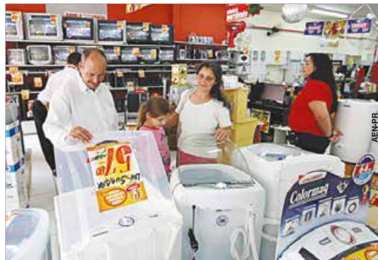
Comércio abriu 16 vagas de emprego no mês de novembro.

Com os números relativos a novembro, Palmeira ainda mantém saldo negativo de postos de trabalho formal este ano. No total foram realizadas 3.655 admissões de trabalhadores e 3.883