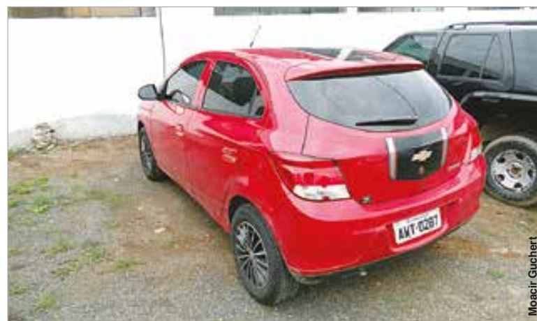
Rapaz que furtou o veículo iria receber R$ 5 mil pelo serviço.

soldado do Exército, afirmou ter furtado o veículo em Ponta Grossa para reparar para um morador de Palmeira, relatando que iria receber R$ 5.000,00 pelo veículo.